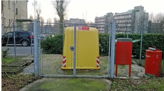
Isola Ecologica Polo Cravino