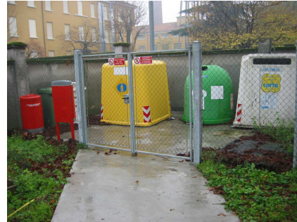
Isola Ecologica Polo Via Forlanini