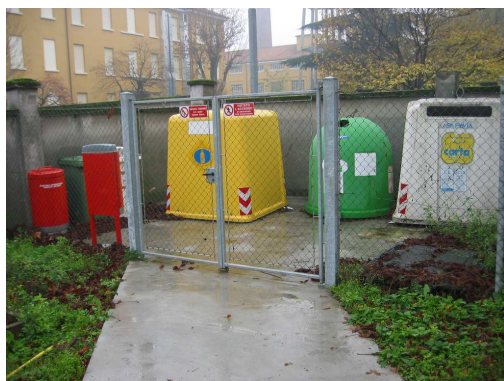
Isola Ecologica Polo Via Forlanini

Ciascuna isola dispone di contenitori per la raccolta differenziata di CARTA, CARTONE, VETRO/LATTINE, PLASTICA, PILE ESAUSTE, FARMACI SCADUTI.