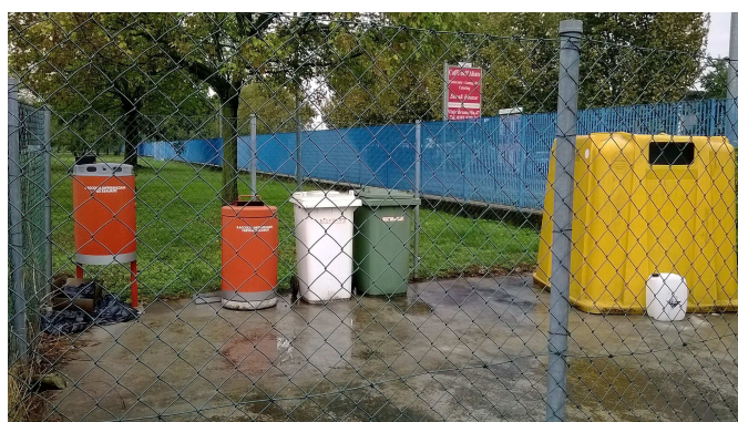
Isola Ecologica Polo Via Ferrata