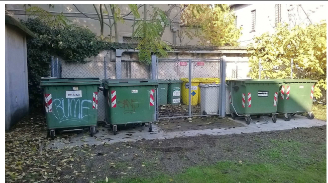
Isola Ecologica Palazzo Botta