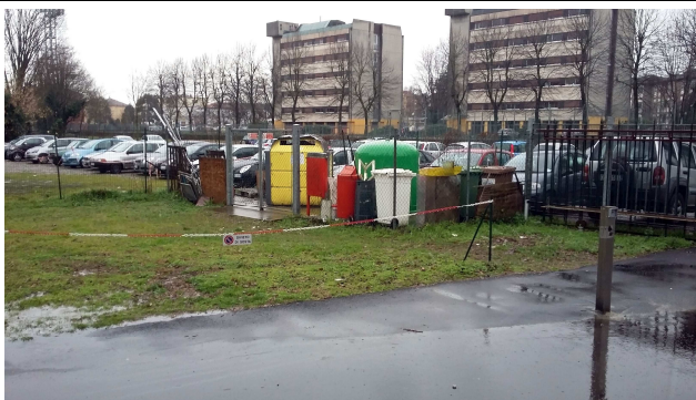
Isola Ecologica Polo via Aselli/Taramelli