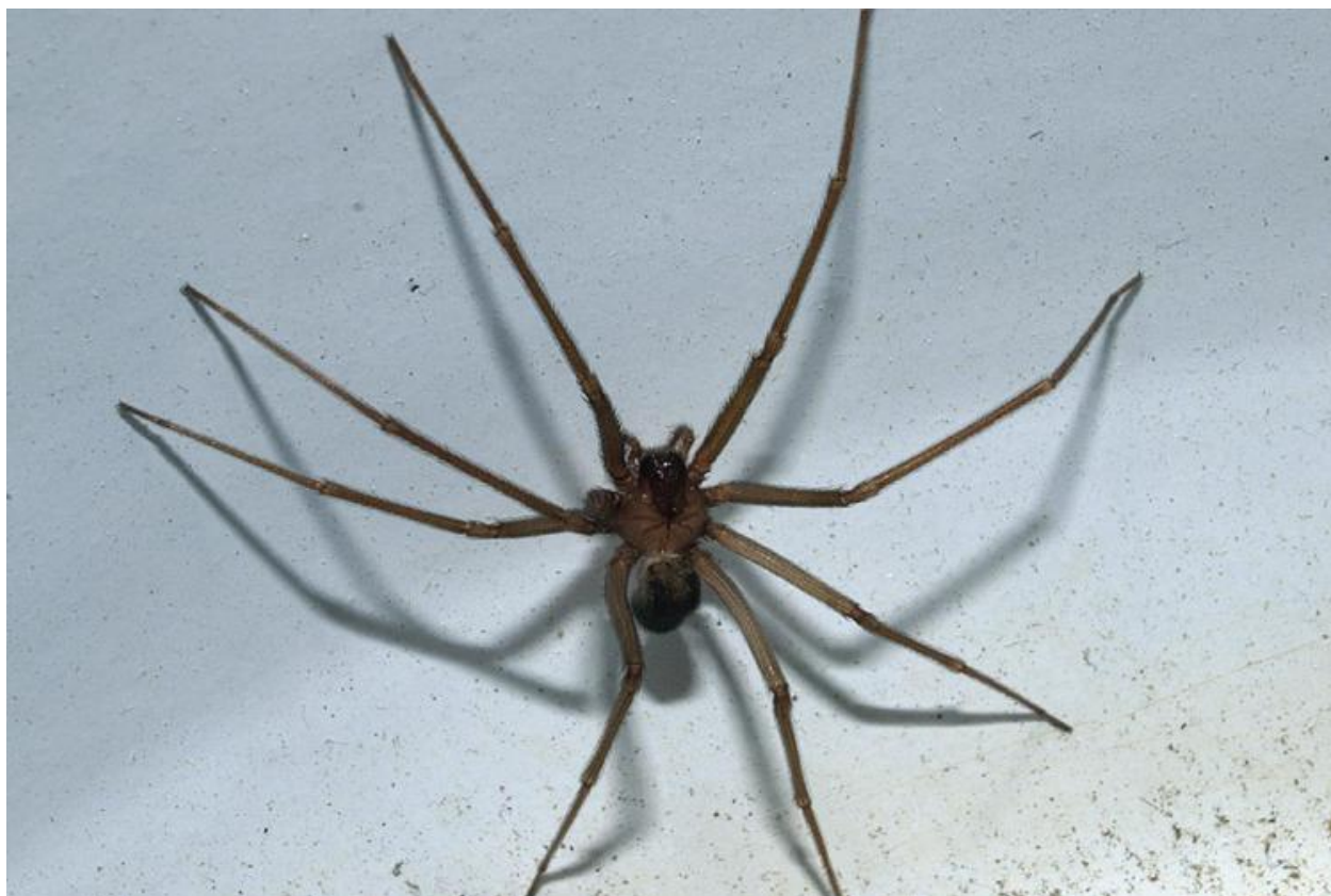
Ragno violino - Wikipedia