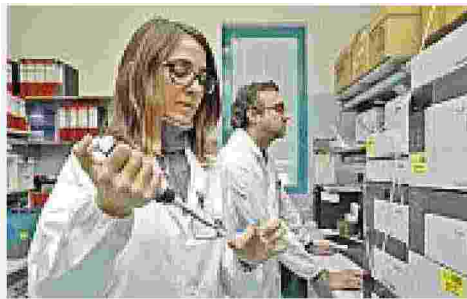
Al lavoro Nel Centro antiveleni dell'Ics Maugeri (Milani)